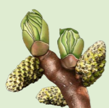
Inicio Brotación/Elongación Amentos