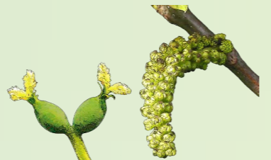
Flor Pistilada/Emisión de Polen